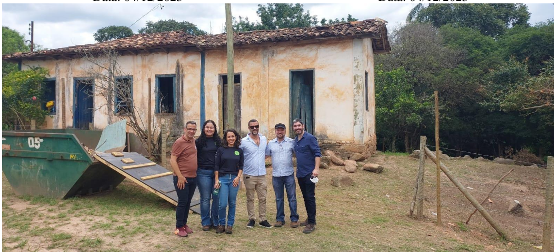
Equipe da Plataforma Semente e do Joaquim Artes e Ofícios Data: 04/12/2023