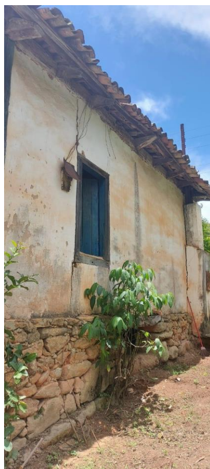
Fachada lateral Autoria: Maria Letícia Ticle