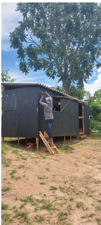
Canteiro de obras Autoria: Maria Letícia Ticle