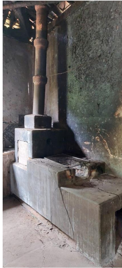
Fogão a lenha – cozinha sofreu incêndio Data: 04/12/2023