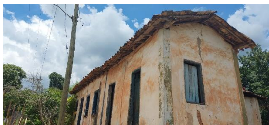
Visão externa da Casinha Vêha

Data: 04/12/2023