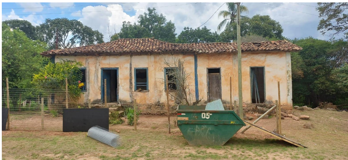
Casinha Velha – fachada frontal Autoria: Maria Letícia Ticle Data: 04/12/2023