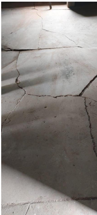
Piso em concreto com estufamento e trincas Autoria: Maria Letícia Ticle Data: 04/12/2023