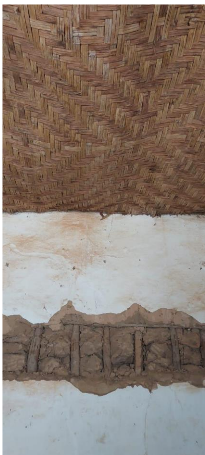
Forro de esteira e trecho da alvenaria em pau a pique

Data: 04/12/2023