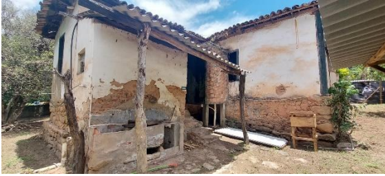
Parte posterior da Casinha Velha Autoria: Maria Letícia Ticle Data: 04/12/2023