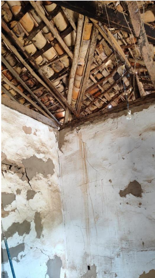
Vista interna do telhado e alvenarias Data: 04/12/2023