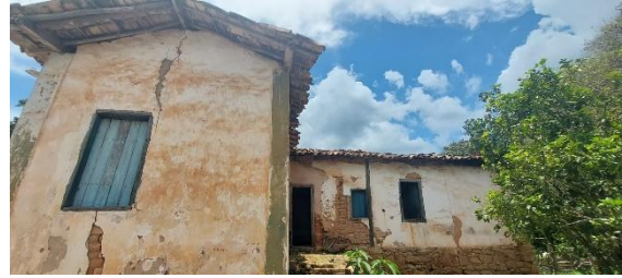
Fachadas laterais Data: 04/12/2023