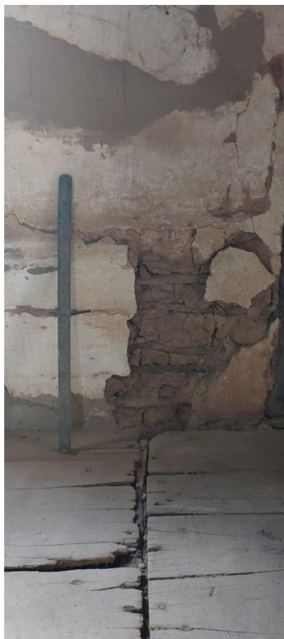
Piso em madeira e alvenaria deteriorados Data: 04/12/2023